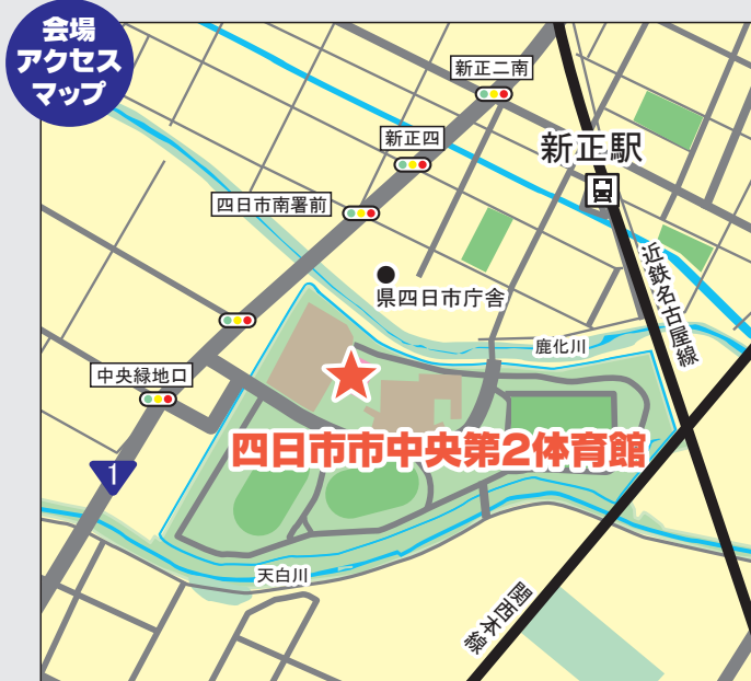
四日市市中央第2体育館 三重県四日市市日永東1丁目3

メールアドレス: info@dosa.or.jp 電話: 03-6380-0345