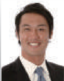
古木 克明 元プロ野球選手