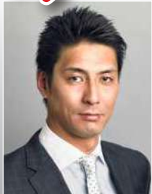
山本 隆弘 バレーボール元日本代表