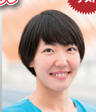
寺田 明日香 100mハードル日本記録保持者 世界陸上日本代表 元ラグビー日本代表練習生