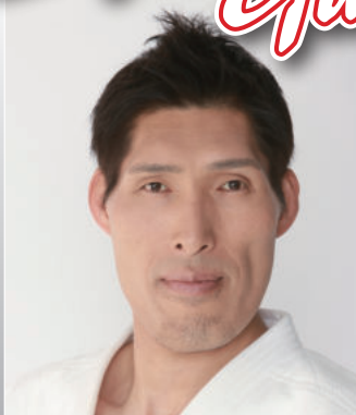
篠原 信一 柔道家