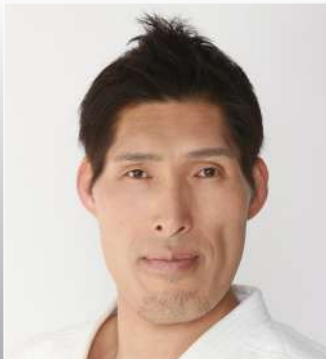
篠原 信一 柔道家