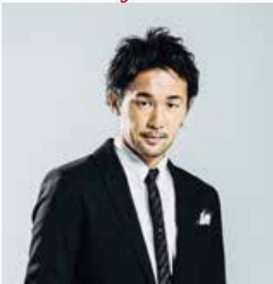
山中慎介 ボクシング